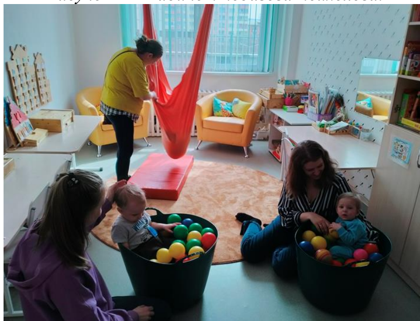
Рисунок 2 – Кабинет учителя-логопеда.