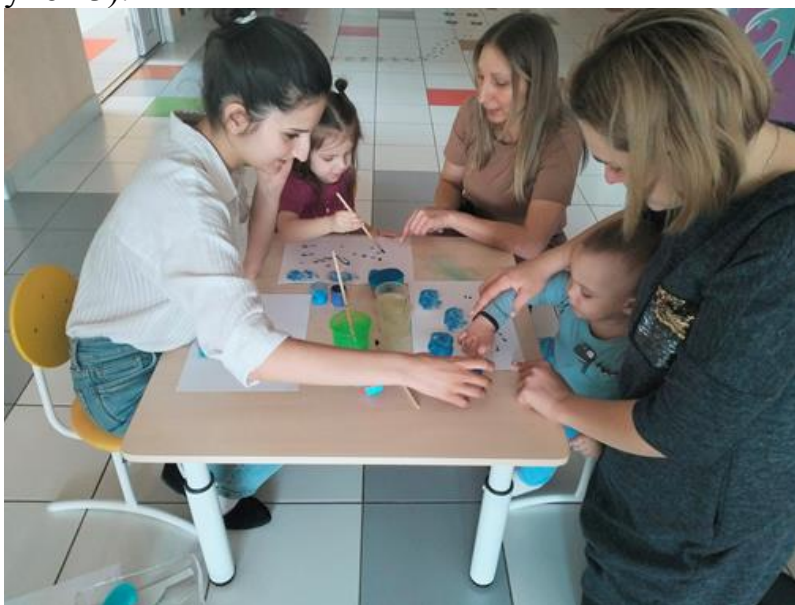
Рисунок 3 – групповое занятие.